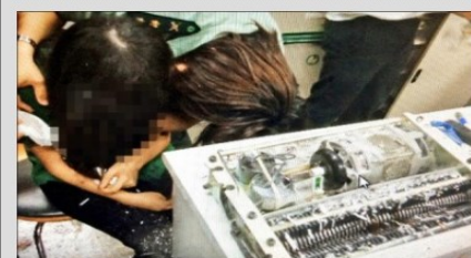
黃姓女學生獲救後，蹲在地下掩面哭泣，教官趕忙上前安慰。